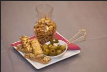
Gezonde hapjes op aanvraag

Diverse kaas en worst hapjes met garnituur