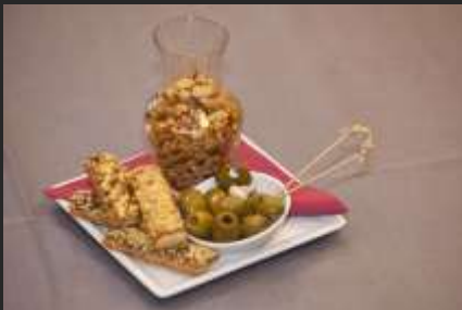
Gezonde hapjes op aanvraag

Diverse kaas en worst hapjes met garnituur